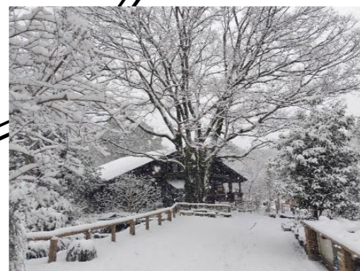
雪景色のくずはの家

新しいシカ柵を設置したほたるの道周辺では、お陰様でシカの痕跡が確認されなくなりました。先日は、進入路の外側からけやきの道の尾根を移動する群れが、昼間に目撃されました。シカの群れに新しい動きが見られています。これから芽吹く春の草花を守れると良いのですが。