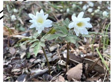
キクザキイチゲ(園芸種)