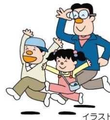
イラスト：阿木二郎

お申込みは電話またはメールにて先着順受付(夏休み自然教室は電子申請e-kanagawaにて受付。応募者多数の場合は抽選) 場所:くずはの広場 参加無料(保険料、材料費が必要な場合があります)