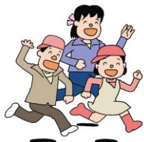
イラスト：阿木二郎