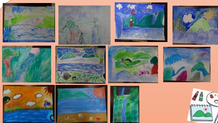
鳥の鳴き声、水の音を聴いてイメージ画