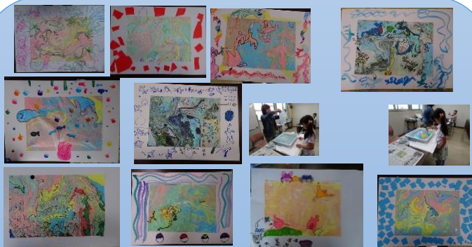
マーズリング技法を使っのイメージ画