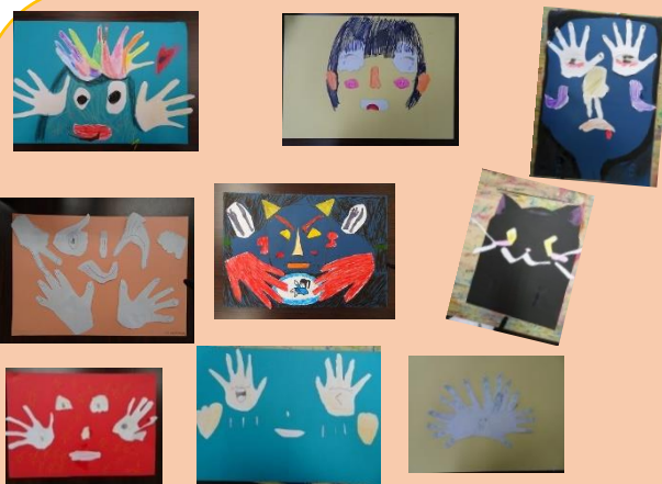
手のひらを型どり、その型を使った表情画