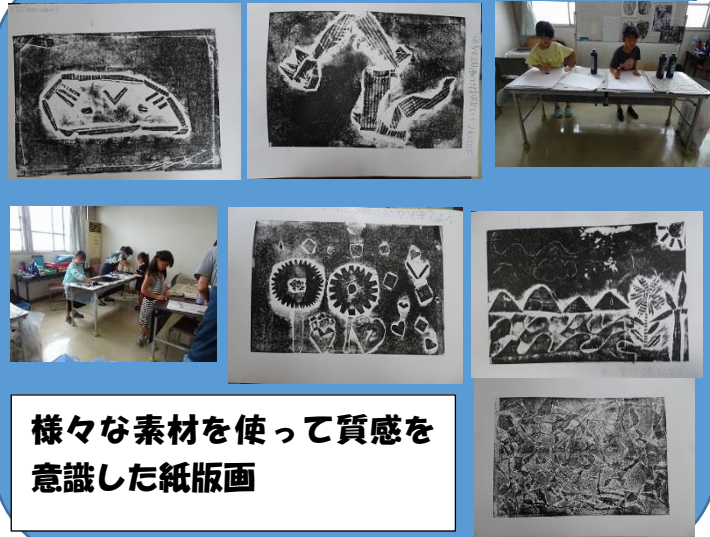
様々な素材を使って質感を意識した紙版画