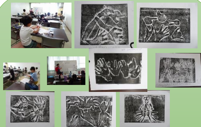
手のひらの型紙を組み合わせた紙版画