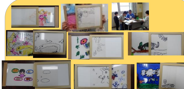
紙を引くと絵が変化する作品作り