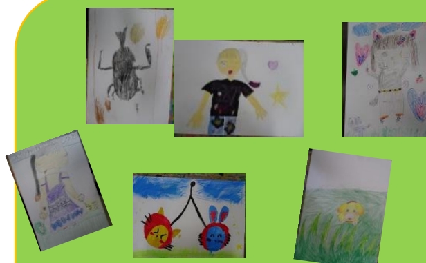
「私は〇〇で、できている」 〇〇の中に好きなもの、考えていること、食べたことなど入れ込んで絵を描く