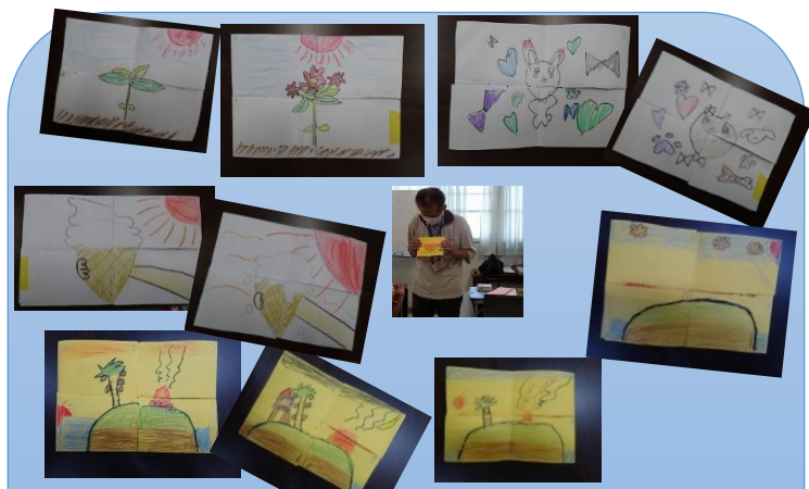
画用紙に切込みを入れて、紙を動かすと描いた絵が変わるカードづくり