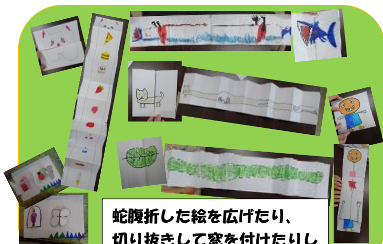
蛇腹折した絵を広げたり、切り抜きして窓を付けたりして変化する絵を制作