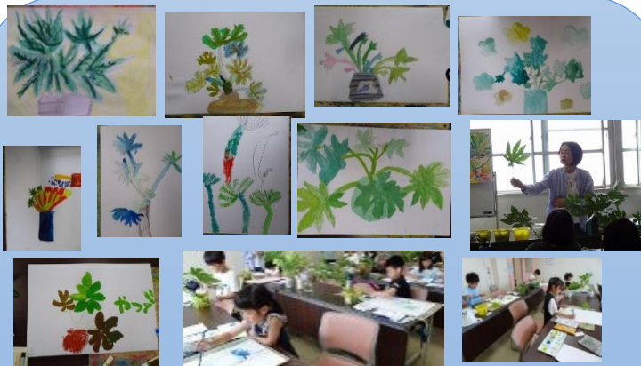
よく見て描こう（ヤツテの水彩画）