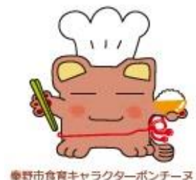
秦野市食育キャラクターボンチーズ

期間は、令和8年度（2026年度）から令和12年度（2030年度）までの5年間とします。ただし、プランの達成状況や社会環境の変化などにより、必要になった場合は、適宜内容の見直しを行います。