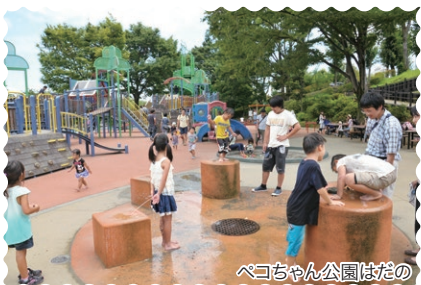
ベコちゃん公園はだの