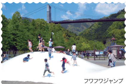
フワフワジャンプ