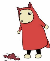
相談員キャラクター クーちゃん

現在、秦野市では9名(11月から12名)の介護サービス相談員が事業所への訪問活動を行っています。