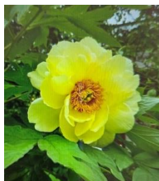
I様の趣味:園芸 お庭の牡丹(R7)