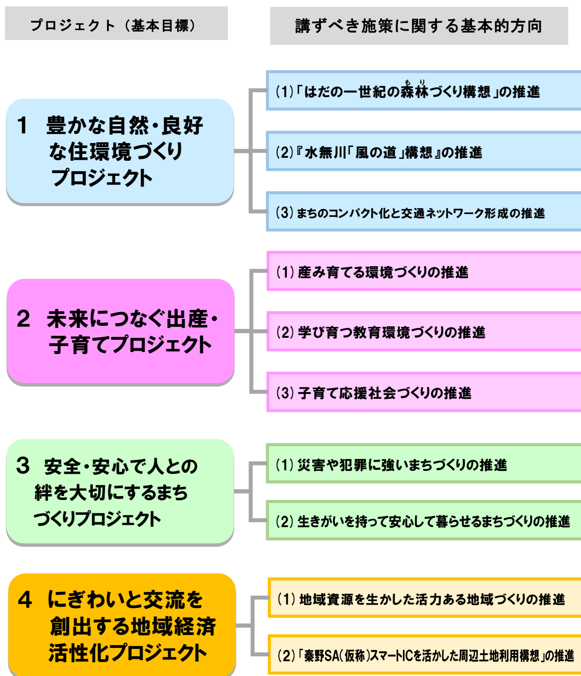
《プロジェクト（基本目標）体系図》

市総合戦略では、人口減少と地域経済縮小を克服するため、地域の特色や地域資源を生かした方策について調査・検討を重ね、プロジェクト（基本目標）を次のとおり設定しました。