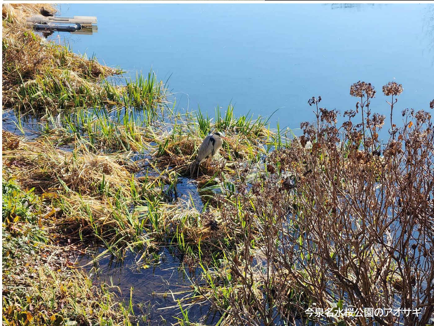
今泉名水桜公園のアオサギ

お正月の賑わいが過ぎ、寒さが一段と深まるこれから、厳しい寒さの中、冬鳥たちが群れをなして飛ぶ姿が見られ、鳥たちにとっても厳しい季節となります。大学入学共通テストが実施され、受験生は厳しい寒さと向き合いながら己の力を試します。