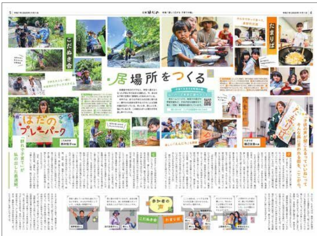
県広報コンクール受賞紙面