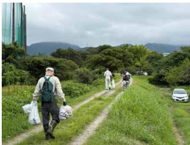
環境ウォーク（四十八瀬川）