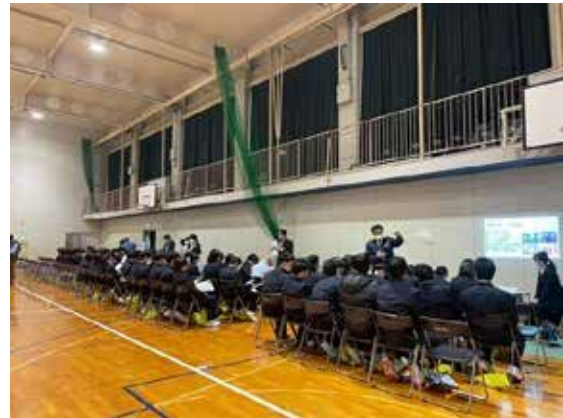
地元企業と高校生との交流会