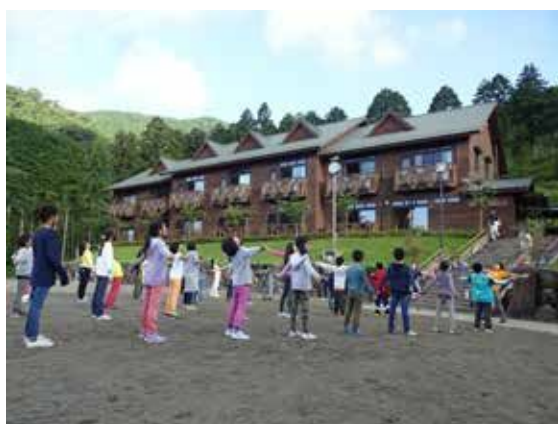
表丹沢野外活動センター