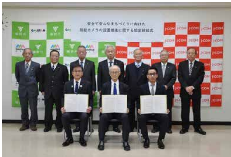
安全で安心なまちづくりに向けた防犯カメラの設置推進に関する協定締結式