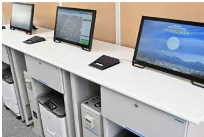
はだのマップステーション