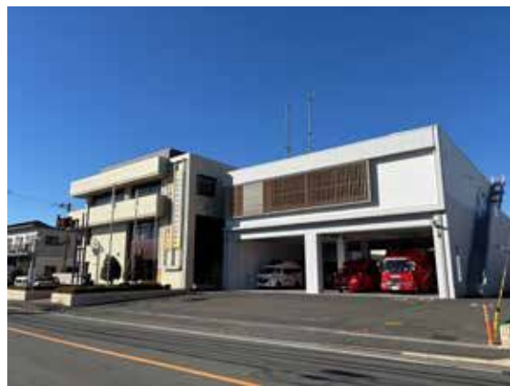
秦野市・伊勢原市共同消防指令センター