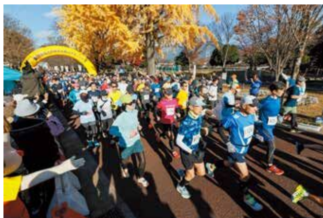
はだの丹沢水無川マラソン大会