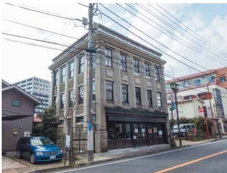
五十嵐商店店舗兼主屋(国登録有形文化財(建造物))