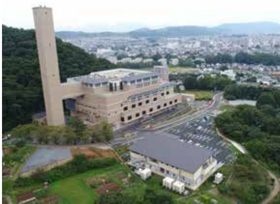
はだのクリーンセンター