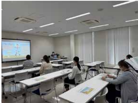
子育て世帯就職相談会