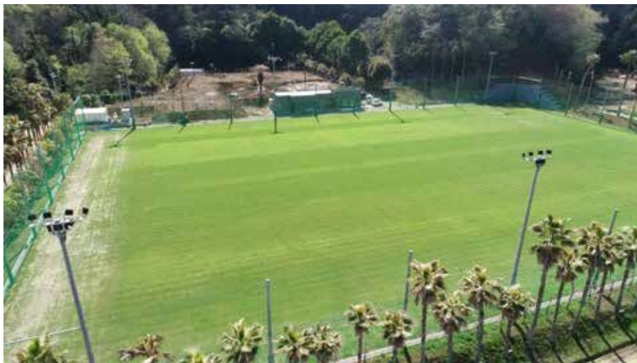
はだのスポーツビレッジ (令和8年3月撮影)