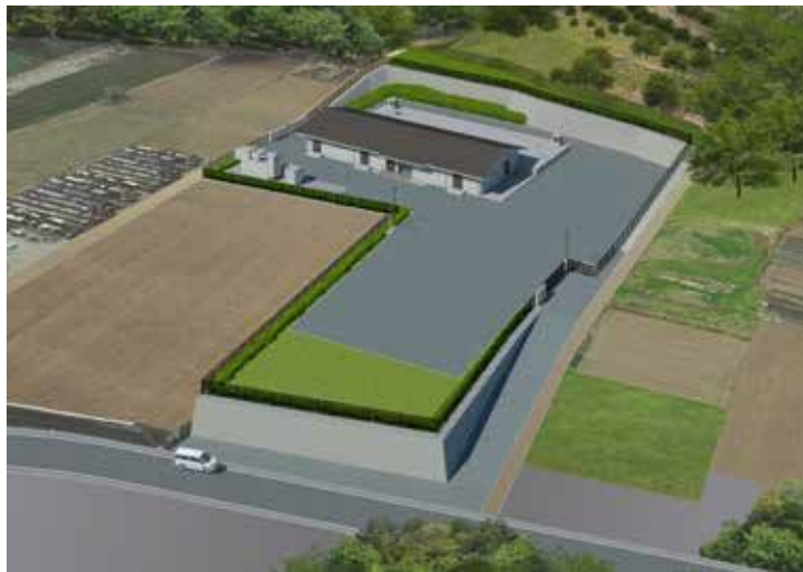
上大槻送水ポンプ場完成イメージ図