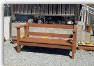
木のぬくもりのあるベンチ

高齢者が座って休めるようにとの意見をもとに、3月に、手づくりベンチを作成し、戸川公園や老人いこいの家ほりかわ荘に、設置しました。