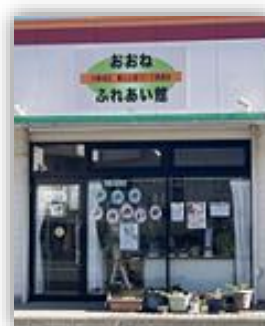
おおねふれあい館