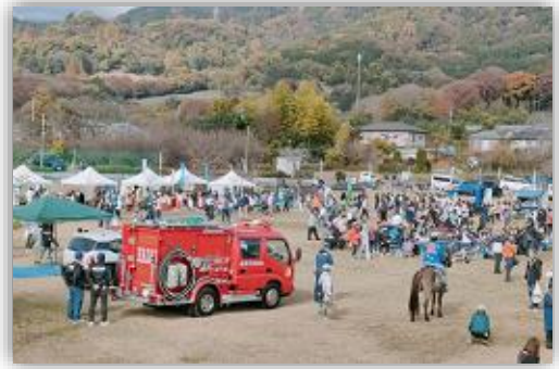
にぎわう中丸広場