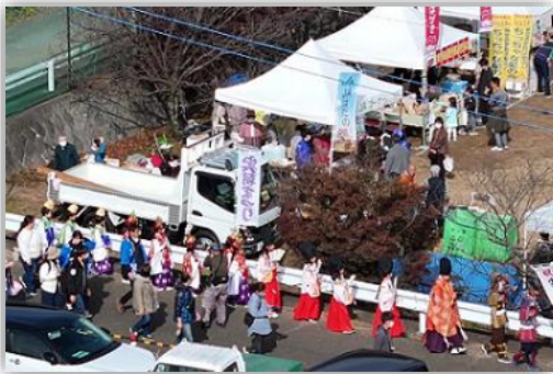
稚児武者行列の頼もしい練り歩き