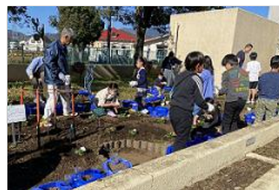
みんなで一緒に花植え

また、老人いこいの家ほりかわ荘や西公民館第2駐車場にも同様に植え付けを行い、環境美化に取り組みました。