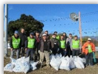
地域力できれいに