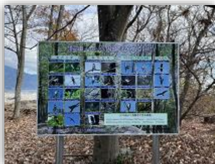
頭高山で野鳥を探そう

9月に、頭高山に野鳥の看板を設置し、身近にいる野鳥を学ぶ環境づくりと地域の魅力づくりに取り組みました。また、看板の同内容のポスターを公民館や小・中学校にも配布し、掲示することで、子供たちの地域への理解促進に取り組みました。