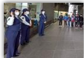
初めての県警本部

3月に、上小学校の児童を対象に、神奈川県警察本部に視察研修に行き、非行化防止の説明など、青少年の健全な育成の支援に取り組みました。