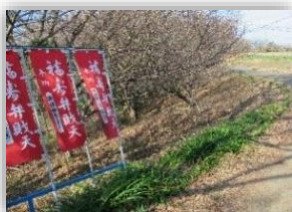
スイセンの開花が待ち遠しい

訪れる人たちに気持ちよく散策していただけるように、地域で活動する団体と合同で震生湖周辺の環境整備に取り組みました。