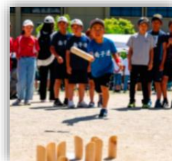
モルックに初挑戦

年齢や体力差に関係なく楽しめる究極のバリアフリースポーツの「モルック」を通じて、子ども会の活性化やコミュニケーション力の向上に取り組みました。