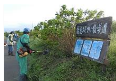
鶴巻あじさい散歩道の会