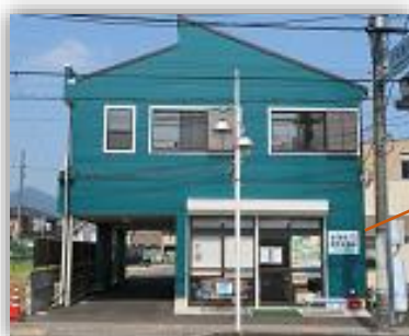
新たに看板が設置された「あつまる！本町交流館」