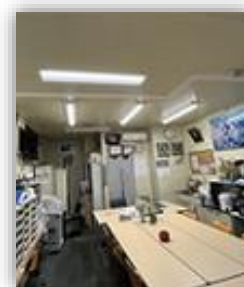
明るくより快適に

おおねふれあい館の照明器具をLED灯に交換し、利用者からも「明るくなった」との喜びの声があり、活動がより充実したものとなりました。