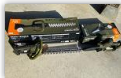
新たに購入したチェンソー

11月に、小型チェンソー及びヘッジトリマーを各5台購入し、頭高山をはじめ、公園等の環境美化活動に役立つように備品の充実を図りました。