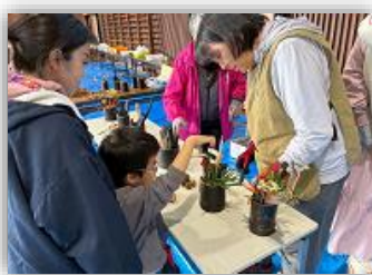
クリスマスリースづくり