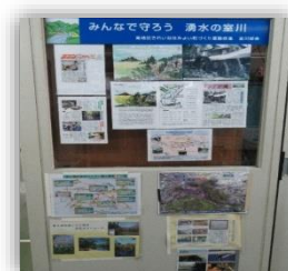
南公民館内に設置された室川部会専用の掲示板