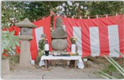
源実朝公御首塚での法要