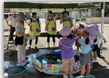
熱心に説明を聞く子どもたち