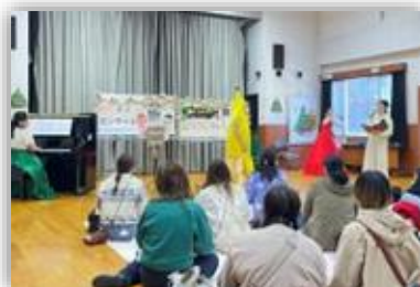
気軽に楽しめるコンサート