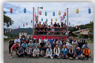
この夏1番の思い出

8月に納涼大会を開催し、地区ごとの太鼓連の演奏や上幼稚園の園児による「アンパンマン音頭」の踊り、花火等が披露され、様々な模擬店を出店し、季節行事の継承と多世代にわたる地域交流の充実に取り組みました。