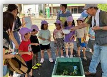
ザリガニ釣りに挑戦