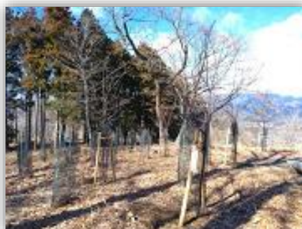
鳥獣対策された桜