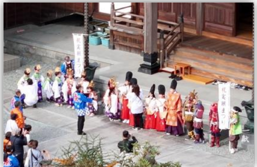
金剛寺に凛々しい姿が並ぶ