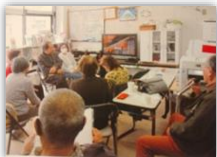
交流館でカラオケを楽しむ