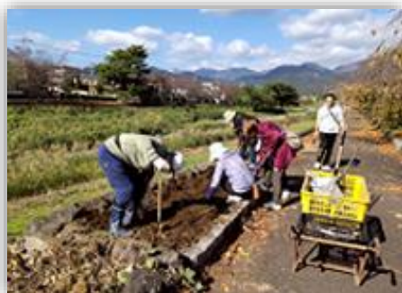
植え替え前の土の耕し

年2回（5月、11月）、令和4年から取り組んでいる水無川左岸（平和橋～堀戸大橋）にある8箇所の花壇に、パンジーとビオラの300株を植え、除草するなど、交流を深めながら、自然・景観の保全に取り組みました。