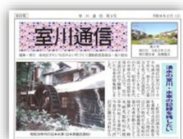
室川の情報が満載

相中留因記恩から・今泉上町芦沢で稼働していた水車の記録をもとに、2月に発行しました。