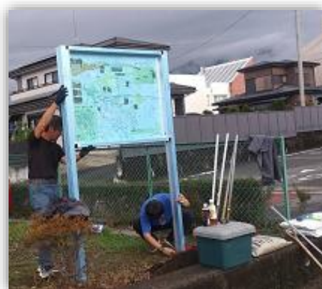
北地区の魅力が満載

北地区まちづくり5か年計画の4年目として、今年度は、7月に戸川地区に地域コミュニティマップを設置しました。名所・行政施設・商店・公園等を掲載し、北地区の風光明媚な街を紹介しています。