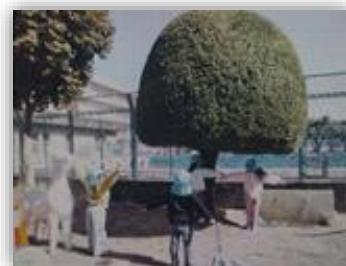
剪定された木の前で

ひろはたこども園の樹木及び植栽や大根小学校の花壇の花植え等のボランティア活動を支援し、地域の環境美化に取り組みました。