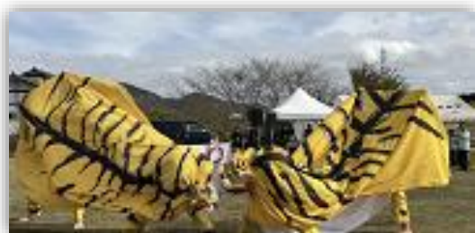
威勢がいい獅子舞