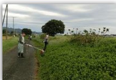
善波川あじさいロードの会