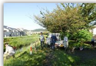
鶴巻親水遊歩道の会

善波川と大根川沿いの2.7キロメートルに及ぶ遊歩道の草刈り等を4グループで毎月1回定期的に行い、あじさい遊歩道の景観の維持に取り組みました。また、6月には、「つるまきあじさい遊歩道まつり」を開催し、当日は、大根川ポンプ場の見学も実施するなど、地域交流と地域の歴史の理解促進に取り組みました。