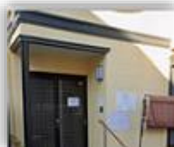
つどいの場 きらく ほっとワークつるまき みんなのて