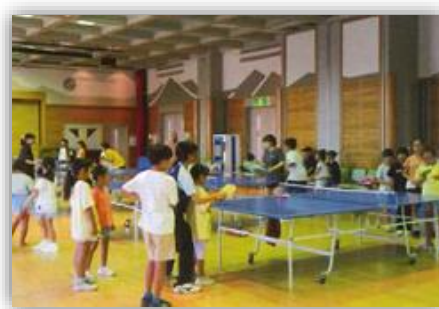
高校生と卓球を楽しむ子供たち