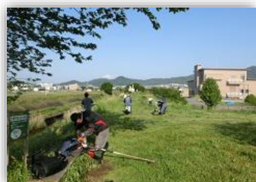
大根川あじさいの会