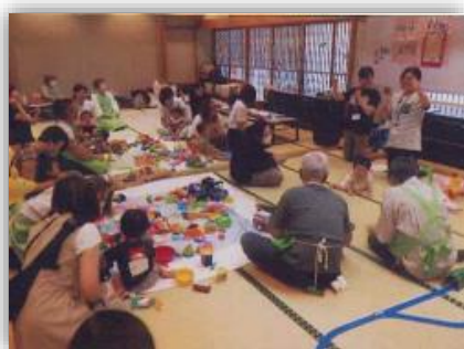
ママとキッズのほっとサロン

6月に、移動プラネタリウムを開催し、星空や宇宙の解説のほか「地球こま」や「星座カード」の手作りワークショップを行い、障害などで星空を見ることが難しい方も参加いただき、お互いが出会い・つながる場を目指しました。