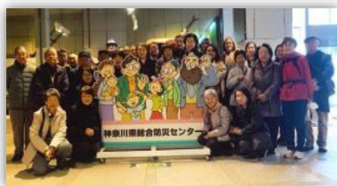
地域防災力の向上を目指して