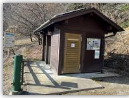
トイレ壁面に看板設置