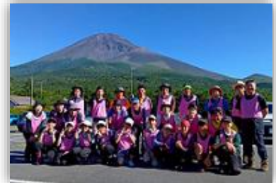
この絆は富士山より高く

7月に、上小学校6年生を対象に、上地区青少年育成部会による富士登山が行われ、児童10人、大人18人が参加して、山頂を目指して登頂し、伝統事業の活動を支援しました。