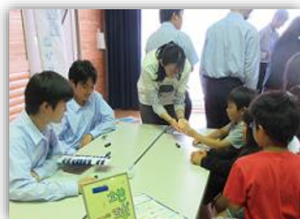
世代を超え学び楽しむ寺子屋