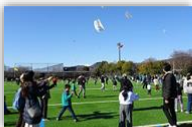
空高く舞い上がれ

1月に、毎年恒例のたこあげ大会をおおね公園で開催し、大勢の参加があり、今では珍しくなった正月の伝統行事の体験や地域交流に取り組みました。