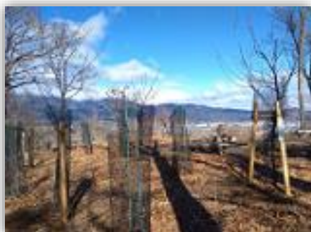
桜の開花が待ち遠しい

また、市と協働して、定期的に頭高山の樹木伐採や除草等を行い、丹沢や足柄平野が見渡せる程、見晴らしが良くなりました。