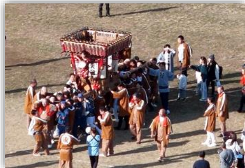
活気あふれる神輿担ぎ