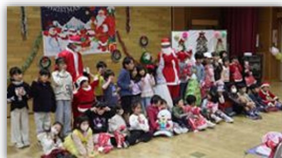
サンタさんとの楽しいひととき