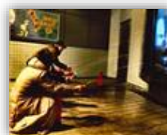
消火器の使い方を学ぶ

多発する荒天による災害や南海トラフ地震などに対する備えと、地域の美観や自然環境整備の推進への知識の醸成を図るため、2月に、各団体の代表者約30名が県総合防災センター及び花菜ガーデンを訪れ、研修会を実施しました。