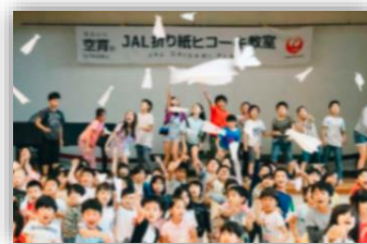
もっと飛べ飛行機

11月に、折り紙ヒコーキ協会の協力により、空の素晴らしさに触れるとともに、折り紙で作った飛行機を飛ばすなど、地球環境の未来について考える教室を開催しました。