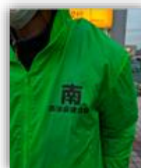
緑色のジャンパー