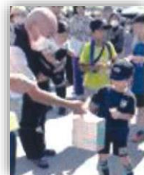
盛り上がる抽選会