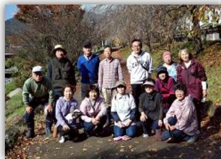
地域の美観を支える