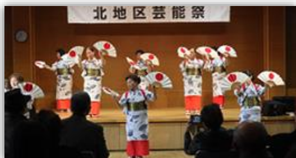
優雅な伝統の舞「ささら踊り」

12月に、北幼稚園児とその兄弟姉妹、保護者を対象に、令和7年度で4回目となる「クリスマス会」を開催しました。クイズ、ゲーム、サンタさんからのプレゼントなどの楽しい企画により、子育て世代をはじめ、地域のふれあいづくりに取り組みました。