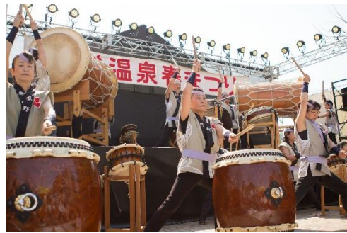
和太鼓が会場を盛り上げる