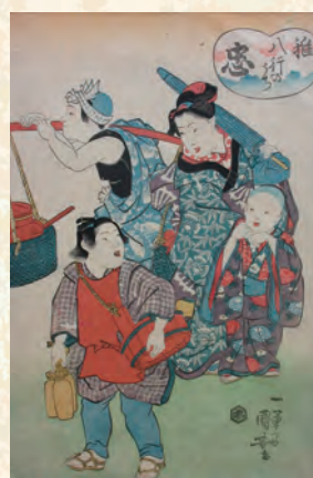
歌川国芳「稚八行のうち 忠」

「こどもの読書週間」に合わせて、子供が描かれた浮世絵や北海道釧路町にある「絵本の館」から借用した絵本原画資料を展示します。