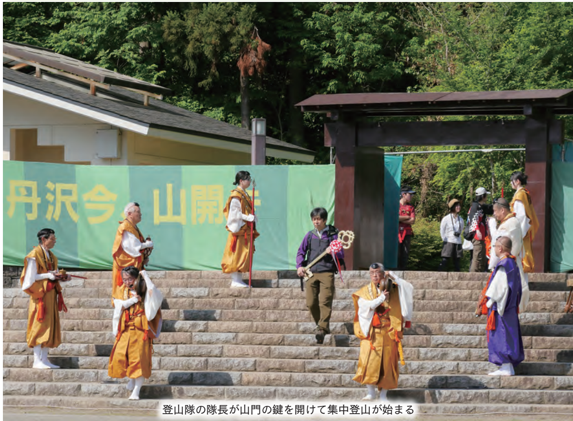
登山隊の隊長が山門の鍵を開けて集中登山が始まる