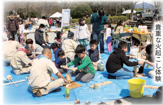
貴重な火起こし体験