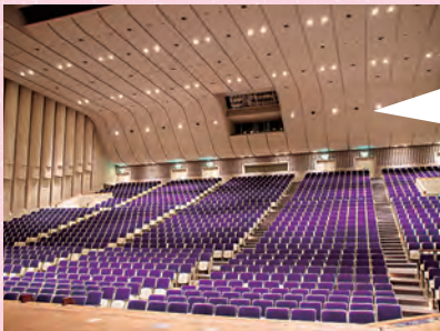
定員約1500人の大ホール

これは大ホールに採用された建築方法です。2階が張り出していないため広々、ゆったり。円柱を並べたような壁面やきれいな曲線を描く天井などが音響効果を高めています。また、親子室や保育室など、小さな子供を連れたの来館にも配慮しています。