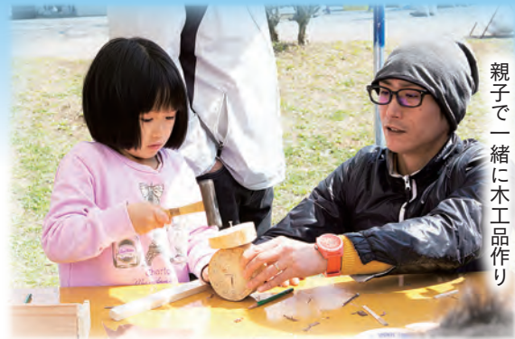
親子で一緒に木工品作り