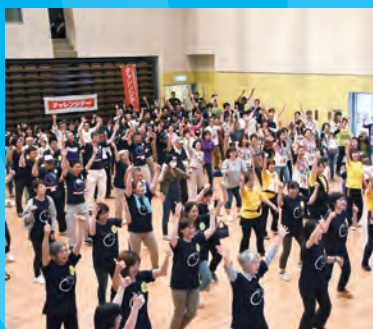
みんなでダンス(昨年の山北町)