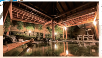
鶴巻温泉弘法の里湯