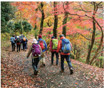
秋は紅葉狩りが楽しめます

東名高速道路・秦野中井ICから、約10分。 → 駐車場はありますが、台数に限りがあります。 弘法山公園第1駐車場(24台)、第2駐車場(15台)、浅間山駐車場(30台)