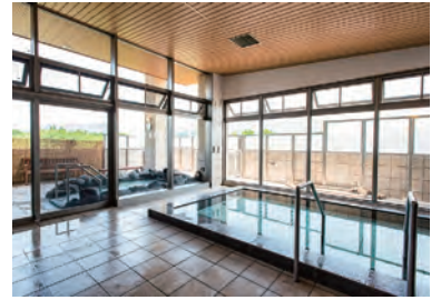
名水はだの富士見の湯