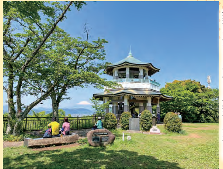
権現山山頂からは富士山も表丹沢も見渡せます