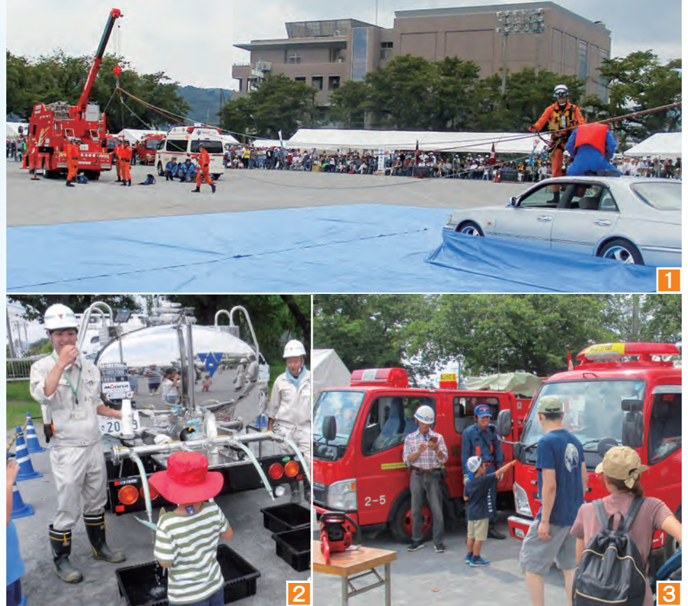
東中学校(合同訓練)では1消防隊による救助・救出訓練、2給水車からの給水訓練、3消防車やパトカーの乗車などを体験