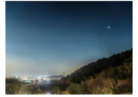
満天の星が広がる