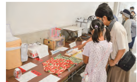
アイデア作品を応募しよう

優秀作品は、9月23日(土)・24日(日)にかなテックカレッジ西部で展示されます。