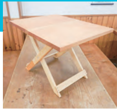
秦野産ヒノキを使用

とき 7月29日(土) 午前10時～午後3時 ところ 里山ふれあいセンター 対象 小学4年生以上と保護者4組 費用 2500円