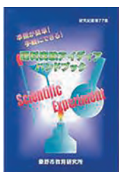
自由研究にも役立つ