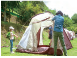
キャンプの基本を学ぶ