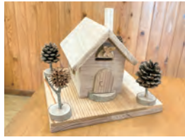
自分だけの作品を作ろう