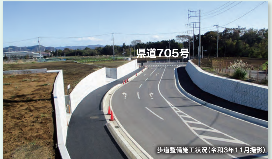
歩道整備施工状況(令和3年11月撮影)