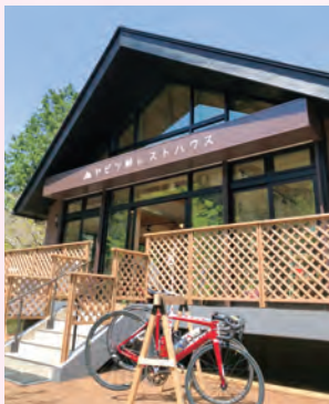
多くのサイクリストなどが集うヤビツ峠レストハウス