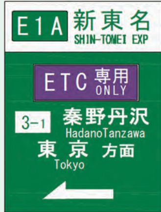
市街地案内標識(※イメージ)

今後は、スマートICの利用者誘導のため、市内の幹線道路を中心に案内標識の設置を進める予定です。