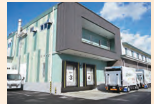
栄養満点でおいしい給食をお届け