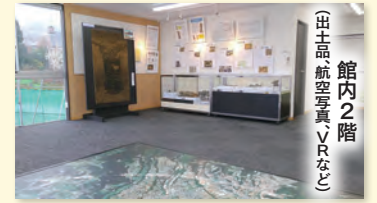
館内2階 出土品航空写真・VRなど