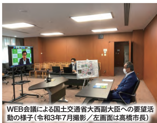
WEB会議による国土交通省大西副大臣への要望活動の様子(令和3年7月撮影/左画面は高橋市長)

今年、新型コロナウイルスの影響もあり、昨年に引き続き、WEB会議システムを利用した要望を実施しました。