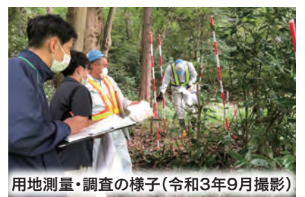
用地測量・調査の様子(令和3年9月撮影)

また、トンネル区間において、現在も地層の層厚や分布状況、地下水の状態等を把握するためのボーリング調査・弾性波探査が行われているなど、着実に事業が進捗しています。