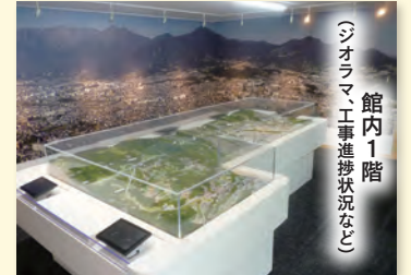
館内1階 ジオラマ・工事進捗状況など