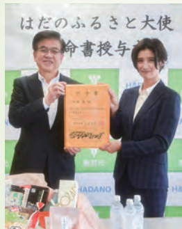
女性初の大使となった加藤氏