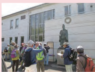
鎌倉武士の歴史をたどる

とき・ところ 3月24日(火)午前9時鶴巻温泉駅南口改札前集合〜天徳寺〜真田神社〜無量寺、岡崎四郎墓〜午後3時大倉バス停 ※雨天中止 定員 50人(申し込み先着順) 費用 500円