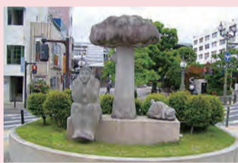
野外彫刻「生命の詩」

とき 3月14日(土) 午前9時〜正午 ところ 秦野駅北口 内容 専門家を講師に野外彫刻の見学とメンテナンス体験 定員 20人(申し込み先着順)