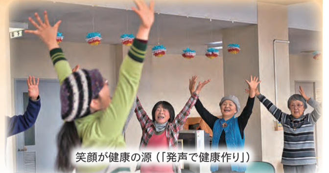
笑顔が健康の源(「発声で健康作り」)