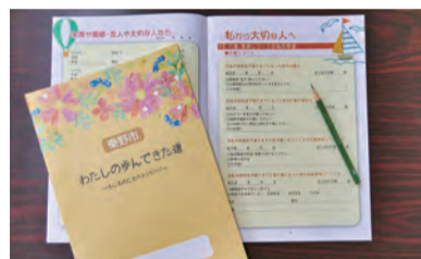
人生を振り返るきっかけに

自身の情報や希望を分かりやすくまとめて、家族に残すエンディングノートをリニューアルしました。配布場所 市役所1階高齢介護課、地域高齢者支援センター ☎市内在住の65歳以上 ☎高齢介護課(82)7394