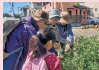
ガイドによる説明付き

とき・ところ 4月5日(日)午前9時秦野駅改札前集合〜弘法山〜午後3時鶴巻温泉駅 定員 30人(申し込み先着順)