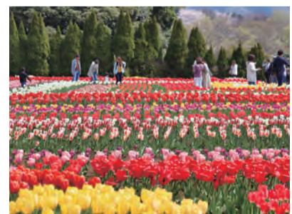
一面に広がる花のじゅうたん