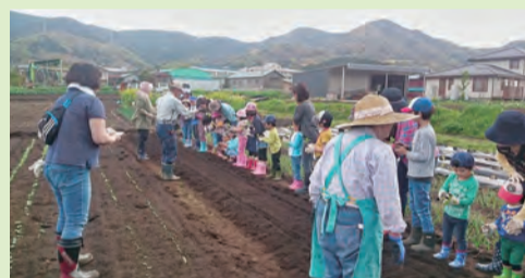
親子で野菜の苗の植え付けを体験

前9時～11時半 20組(申し込み先着順) 支援助センター ☎(81)78000