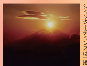
シャッターチャンスは一瞬

富士山の山頂に太陽がちょうど沈んでいくとき、まるでダイヤモンドのようにきらめく神秘的な一瞬。その瞬間を市内で撮影しませんか。