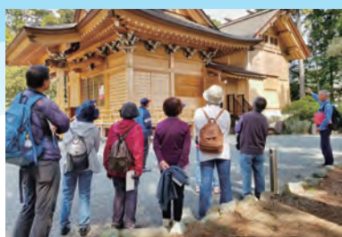
秦野の歴史も学べる

とき・ところ・対象 4月19日(日) 澁沢丘陵コース 午前8時40分分沢小学校集合〜千村生き物の里、頭高山〜午前10時半 小・中学生20人 自然観察の森コース 午前8時40分県立秦野戸川公園集合〜自然観察の森〜午前11時 小学生の親子20人 歴史・文化コース 午前8時40分県立秦野戸川公園集合〜堀之郷正八幡宮、蔵