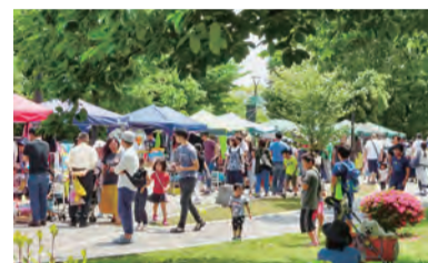
多くの店にぎわう

時5月23日(土) 24日(日) 場クアーズテック秦野CH(文化会館)とその周辺 定38店(抽選) 費4000円 申3月27日(金)までに商工まつり実行委員会☎(81)1355へ 内産業振興課☎(82)9646