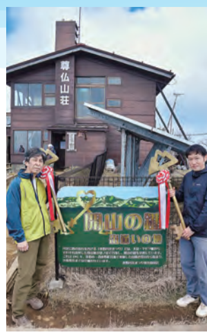
塔ノ岳山頂で鍵の交換式