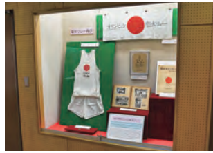
秦野とスポーツの歩みを紹介

時 3月7日(土) 午後1時半～2時 場 桜土手古墳展示館 ※企画展は3月22日(日)まで。 問 桜土手古墳展示館 ☎(87)5542