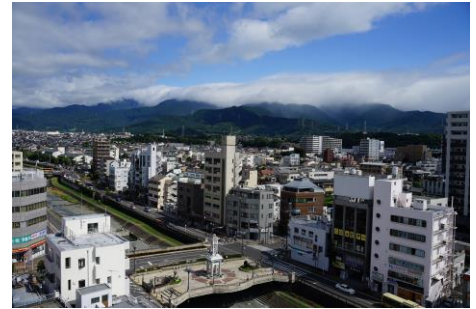
秦野駅北口の街並み

秦野駅北口周辺のにぎわい創造を目指し、令和4年度から作成を進めている「まちづくりビジョン」で描く将来像の実現に向け、水無川沿い市道の交通規制を実施して社会実験を行います。