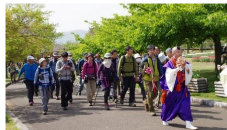
集中登山の様子(第63回)

「山開き式」終了後、集中登山隊(一般参加含む)が大倉から塔ノ岳へ向けて出発します。