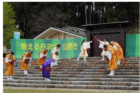
山伏による峰入りの儀(第63回)

丹沢の美しい山並みを背景に、観光和太鼓やコーラス、アルプホルンの演奏が披露された後、山伏によって清められた山門が開かれ、表丹沢の本格的な登山シーズンの幕開けを告げます。