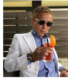
本田圭佑選手のモノマネで有名

R-1ぐらんぷり2015優勝者で、キャンプが大好きな、じゅんいちダビッドソンさんによるお笑いライブです。