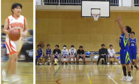
【バスケット部1回戦の試合】

私はいつも部活動の大会の応援を楽しみにしています。しかし、今回は大いに反省しなければいけません。バスケットの大会で応援が熱くなりすぎて、審判のジャッジに文句を言ったつもりはなかったのですが、大きな声で「ホール(ホールディング)」と叫んでしまいました。結果的には保護者の皆様にも生徒の皆さんにもご迷惑をおかけしてしまいました。審判の方には試合終了後謝罪しました。今後はマナーに優れた熱い応援を心掛けます。夏の大会に向けて練習を頑張らしましょう。