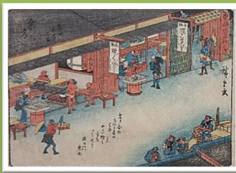
桑名 富田立場之図