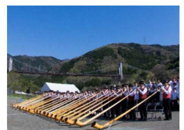
丹沢の山開き（丹沢まつり）