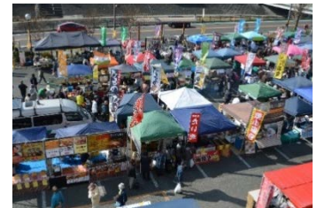
市内外から70店舗が参加 (はだの朝市まつり)