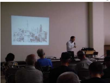
10月10日 「ジャズレコードを楽しもう」