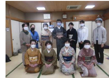
10月31日 「きもの着付け教室」