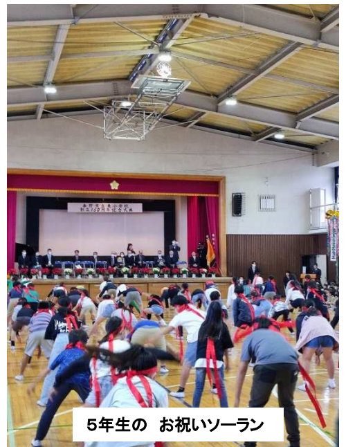
5年生の お祝いソーラン