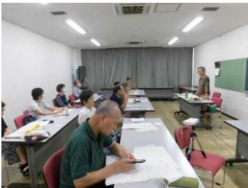
9月2日、9日、23日、30日、10月7日 「学びなおしの物理」