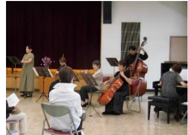
10月4日 「東のお山のコンサート」