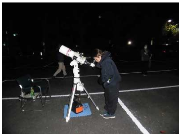
10月22日 「親子天体観察会」