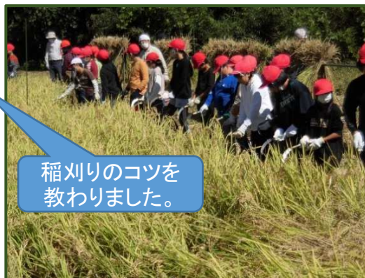
稲刈りのコツを教わりました。

10月6日(金) 午前10時から11時 東公民館裏の田んぼで小学校5年生を対象にした農業体験が行われていました。田植えから稲刈り、さらに収穫祭、課外行事を通して、自然の恵みに感謝することが出来ました。収穫したお米120kgは給食で美味しく頂きました。