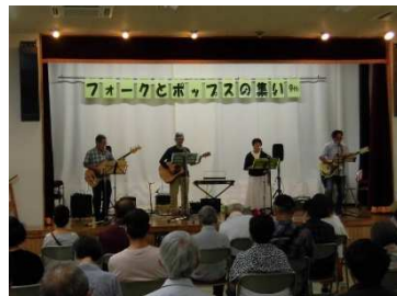
9月10日 「フォークとポップスの集い」