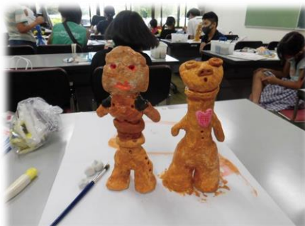
8月3日(火) 君も縄文人「紙ねんどで土偶を作ろう」