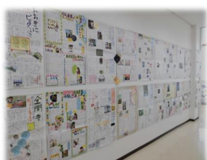
7月24日～8月29日 『家族新聞作り講座』20周年記念展示