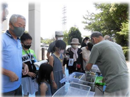
8月1日(日) 昆虫教室「スズムシを飼おう」