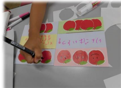
7月31日(土) 親子で工作・からくり絵本