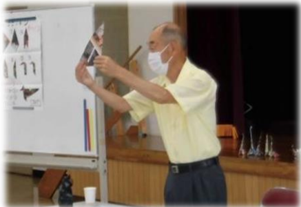
7月24日(土) 恐竜折り紙教室