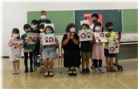
7月29日(木) 親子折り紙教室