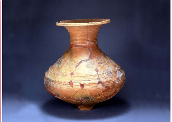
弥生時代遠賀川系土器(県重要文化財)

今回の「ちょっと前から遙か昔の暮らし」展では、タバコ耕作をおこなっていたちょっと前から遙か昔の先史時代以降、秦野で暮らしていた人々について、写真や民具、市内出土の土器・石器から分かりやすく解説します。