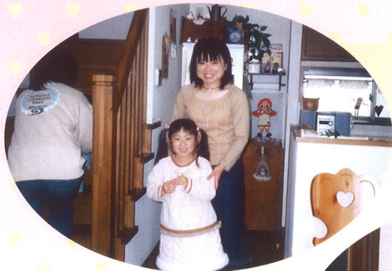
支援会員さんのお宅にて