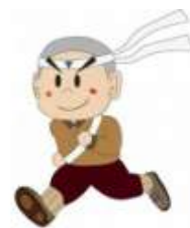
再配置推進イメージキャラクター 「丹次つなぐ君」

したがって、管理運営に関わる常勤職員の労力等に基づき、平均賃金により算定した人件費を加算していることなどから、各施設の事業費の決算額とは異なります。