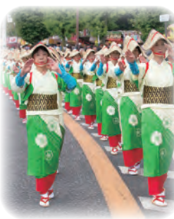
華やかな千人パレード