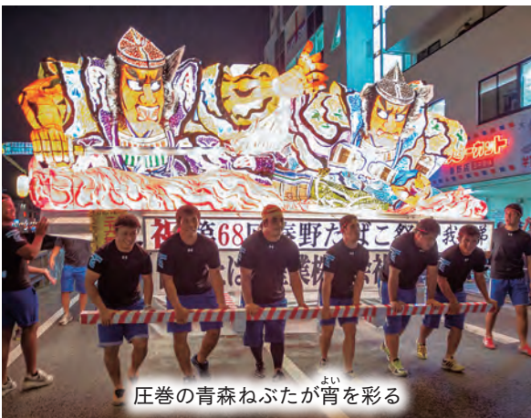
圧巻の青森ねぶたが宵を彩る