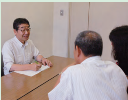
相談員が親身に対応

会場は、 市 =市役所 東 =東海大学前駅連絡所 保 =保健福祉センター 西 =西公民館 鶴 =鶴巻公民館 ほ =ほうらい会館 農 =秦野駅前農協ビル3階 す =地域活動支援センターすみれ(今川町2-15-602)。各相談とも、祝・休日はお休みします。