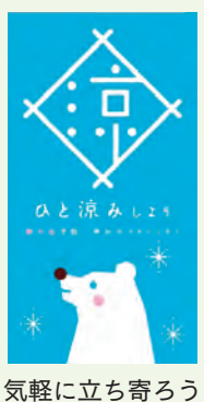
気軽に立ち寄ろう

問い合わせ 警防対策課 ☎(81)7991 または健康づくり課 ☎(82)96003