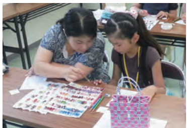
何色にしようかな

とき 8月23日(火) 午前10時～正午 対象 小学4～6年生の親子10組20人(申し込み先着順) 申し込み 7月15日午後1時～