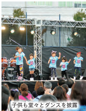
子ども堂々とダンスを披露