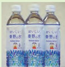
「おいしい秦野の水」

とき 午前9時～午後3時 コース 秦野駅湧水～本町地区商店街～弘法山(清掃登山)～弘法の里湯 対象 小・中学生と保護者100人(申し込み先着順) 費用 100円(1人当たり) ※弘法の里湯は小・中学生無料、保護者は割引あり。参加者にはペットボトル「おいしい秦野の水」などの記念品をプレゼント