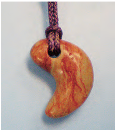
まが玉のアクセサリ

とき 7月28日(木)～31日(日) 午前10時～午後3時 ところ 桜土手古墳展示館 定員 各回8組(申し込み先着順) 費用 500円