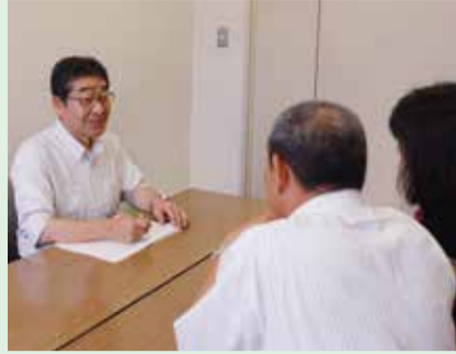
相談員が親身に対応

会場は、 市 =市役所 大 =東海大学 前駅連絡所 保 =保健福祉センター 西 =西公民館 鶴 =鶴巻公民館 ほ = ほうらい会館 農 =秦野駅前農協ビル 3階 す =地域活動支援センターすみ れ(今川町2-15-602)。各相談とも、 祝・休日はお休みします。