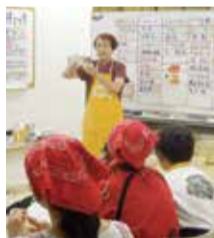
食品の安全も学ぶ

とき 7月28日(火) 午前10時～正午 ところ 保健福祉センター 申し込み 親子20人(申し込み先着順。小学5年生以上は単独参加可) 費用 1人100円