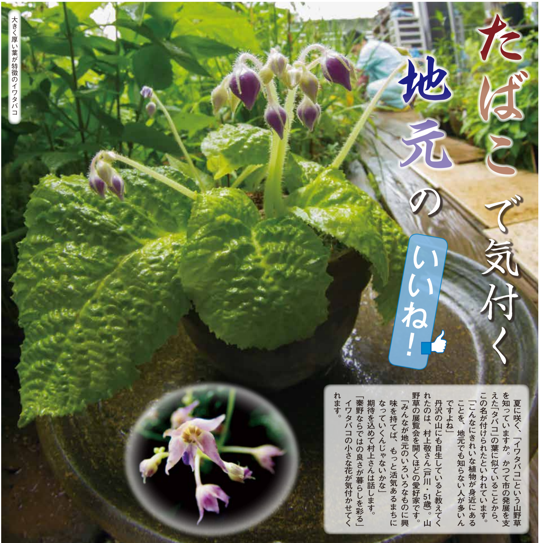
大きく厚い葉が特徴のイワタバコ

編集・発行 秦野市 市長室広報課 〒257-8501 秦野市桜町一丁目3番2号 代表 ☎0463(82)5111 FAX 0463(82)9792 http://www.city.hadano.kanagawa.jp