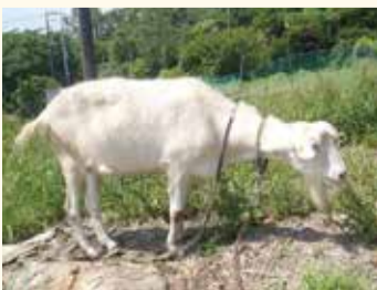
人懐っこい「ヒマワリ」