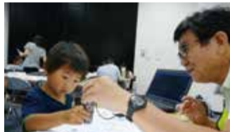
上手にできるかな

とき 8月26日(水) 午後1時～3時半 ところ はだのクリーンセンター(曾屋4624) 内容 リコーサイエンスキャラバン隊と一緒に自分が描いた絵をスキャンし、パソコン上でレースゲーム 対象 小学生50人(3年生以下は保護者同伴) 申し込み 7月15日(水)午前9時～