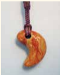
まが玉のアクセサリ

とき 7月29日(水)～31日(金) 対象 各日小学4年生～中学生18人(申し込み先着順)