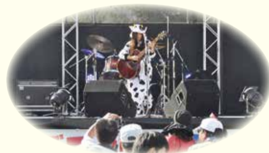
特技を披露しよう