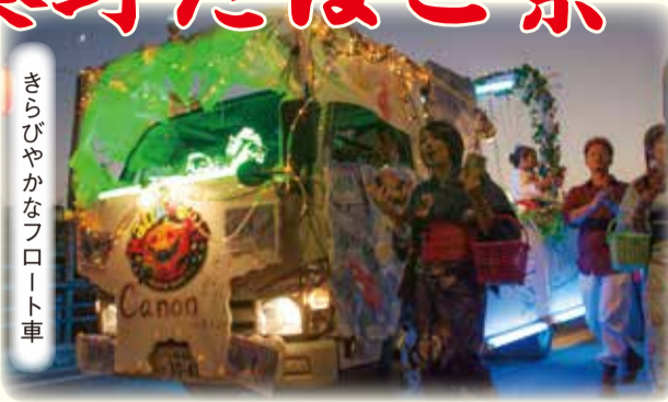
きらびやかなフロート車