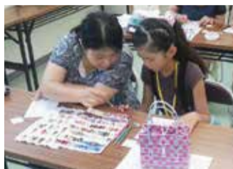
このデザインにしようか

とき 8月18日(火) 午前10時半～午後0時半 ところ アイム湘南美容教育専門学校(尾尻536-1) 対象 小学4年生以上と保護者10組20人 申し込み 7月15日(水)午後1時～