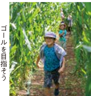
ゴールを目指そう