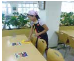
テーブルをきれいに

とき 8月19日(水) 午前10時～午後2時 ところ (株)日京クリエイト(堀山下1(株)日立製作所内) 内容 テーブル準備や配膳など 対象 小学4年生以上8人 申し込み 7月15日(水)午後1時～