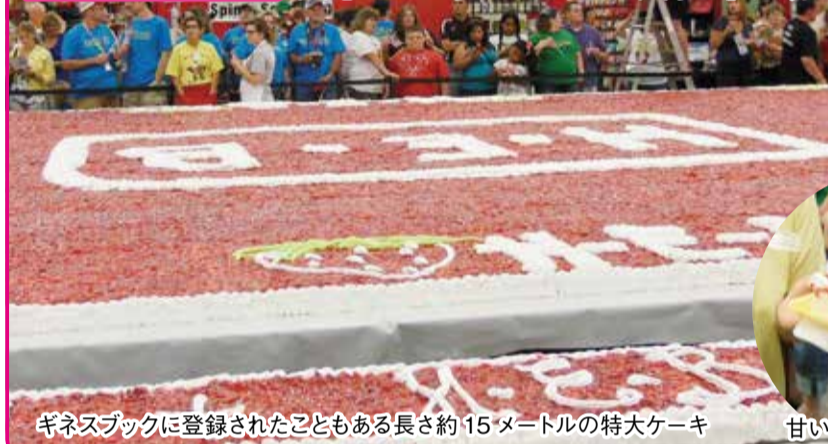
ギネスブックに登録されたこともある長さ約15メートルの特大ケーキ 甘いイチゴがたぐさ

かつて「アメリカ南部のイチゴの首都」といわれたバサデナ市のイチゴ栽培の歴史を今に伝えるため、毎年5月に開催。世界最大級のイチゴのショートケーキや、パレードなどで盛り上げられます。ショートケーキは、開催期間中、切り分けて販売されます。