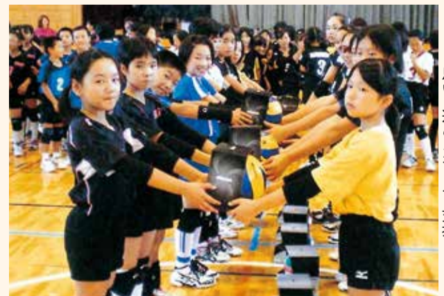
思いを込めたボールを交換

ソフトボールの選抜チームが試合を通じて交流します。また、小学生のバレーボールチームやサッカーチームが試合などを通じ、親睦を深めます。