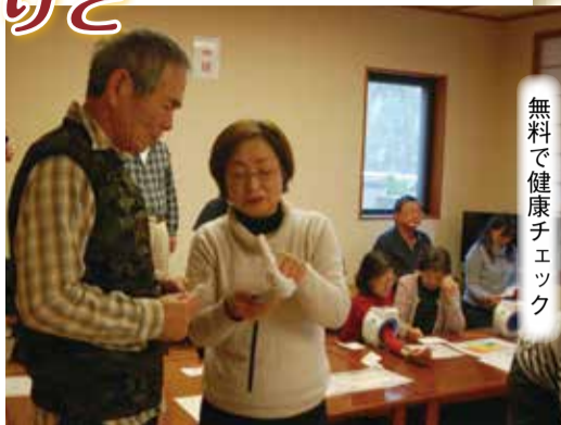
無料で健康チェック