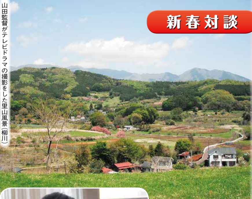
山田監督がテレビドラマの撮影をした里山風景(柳川)