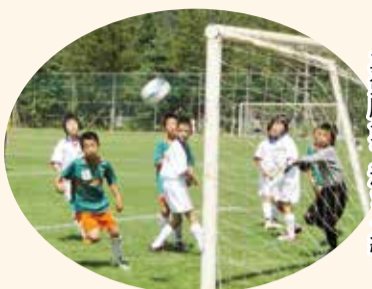
真剣勝負で深まる絆

両市の小学生選抜チームが隔年でそれぞれの市を訪れ、交流試合を通じて親睦を深めます。