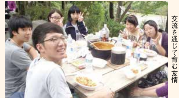
交流を通じて育む友情

両市の中学生が本市の表丹沢野外活動センターなどで一緒に宿泊し、キャンプファイヤーなどの野外活動を通じて、親睦を深めます。