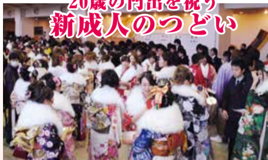
一生に一度の記念日に

とき 1月13日(月) 午前10時半～正午 ※午前9時45分受け付け開始 ところ 文化会館 対象 平成5年4月2日～6年4月1日に生まれた方 注意 文化会館正面駐車場は改修工事のため、利用できません。カルチャーパーク第1駐車場(文化会館東側)などを利用してください