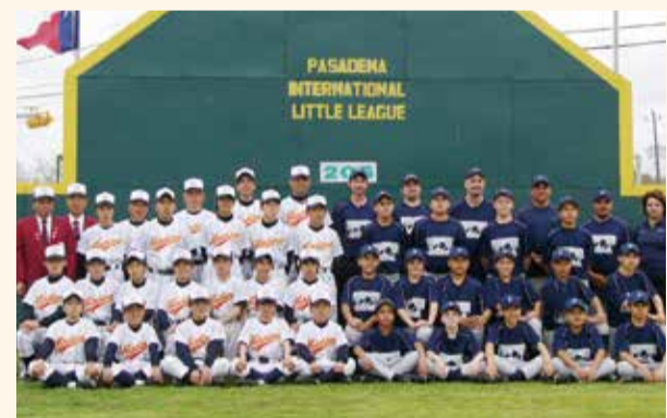
一生の思い出をつくる

本市の小学生選抜野球チームがバサデナ市を初めて訪れ、地元の少年野球チームと交流試合をしました。