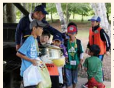
共同作業で心を一つに

両市の小学校高学年から中学生が、それぞれの市で一緒に宿泊し、自然体験やレクリエーションを通じて相互に交流を深めます。