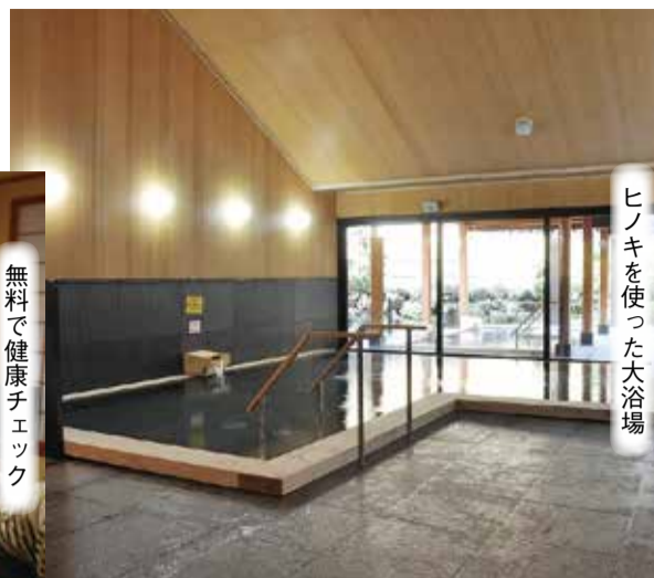
ヒノキを使った大浴場