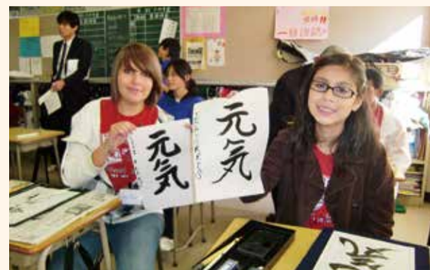
浜沢中学校で書道体験

親善訪問団と共にトンプソン中学校の生徒が初めて秦野を訪ね、中学校の授業やバーベキューに参加して、触れ合いました。