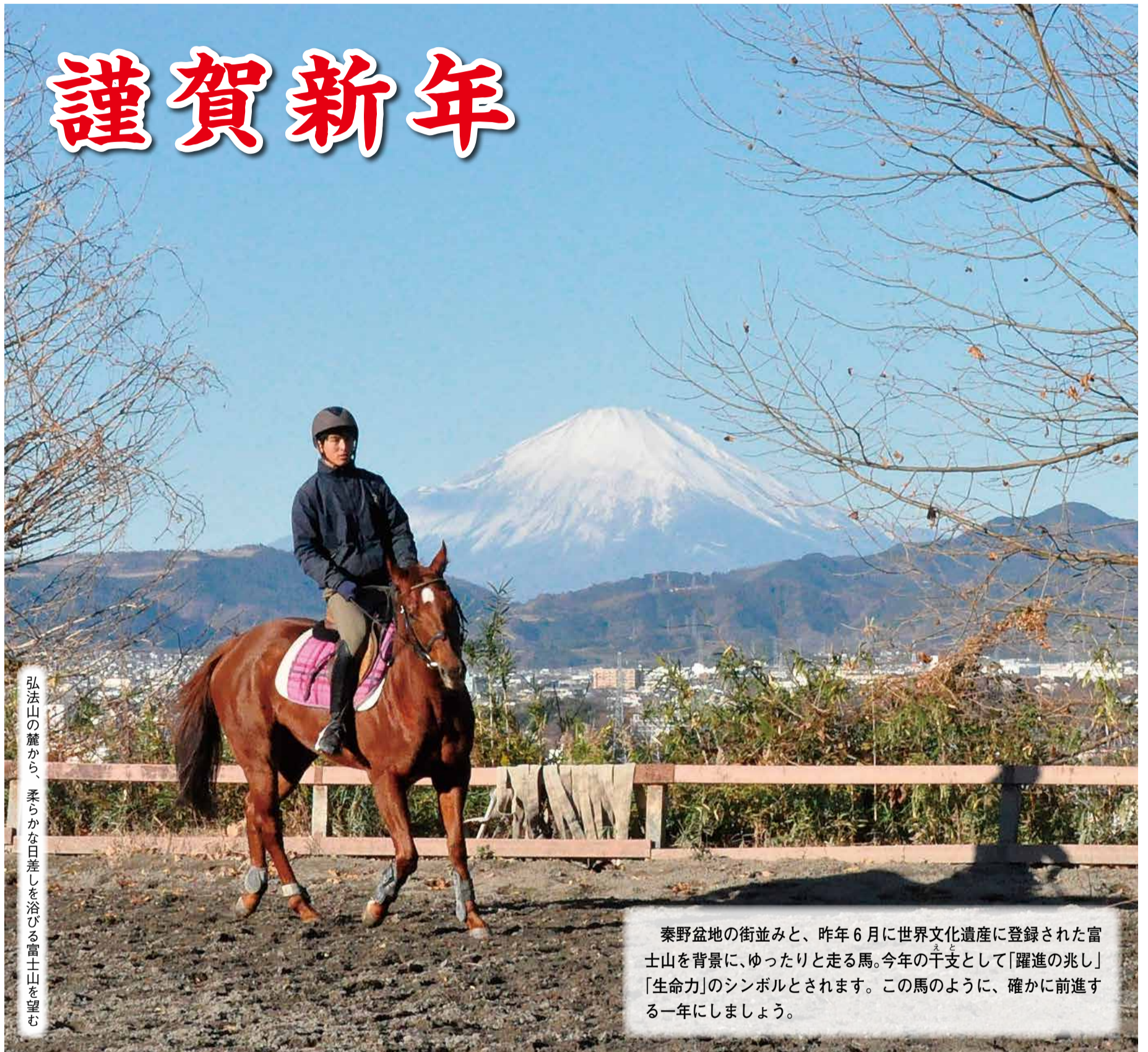
弘法山の麓から、柔らかな日差しを浴びる富士山を望む

秦野盆地の街並みと、昨年6月に世界文化遺産に登録された富士山を背景に、ゆったりと走る馬。今年の干支として「躍進の兆し」「生命力」のシンボルとされます。この馬のように、確かに前進する一年にしましょう。