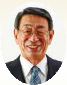
秦野市長 古谷義幸