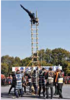
迫力あるはしご乗り演技

とき 1月11日(土) 午前9時半～正午 ところ 総合体育館駐車場 ※雨天時は総合体育館 内容 消防団員表彰、はしご乗り演技、消防車両分列行進、一斉放水演技など ※午前7時にサイレンを鳴らしますが、火災と間違えないようにしてください。