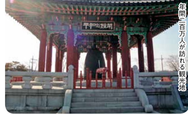
年間二百万人が訪れる観光地