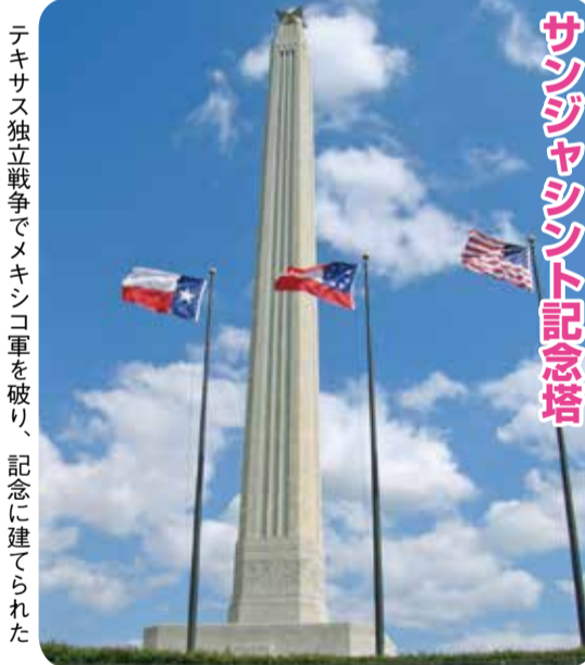
サンジャシントウ記念塔

秦野市農業協同組合、秦野市観光協会、秦野ロータリークラブ、秦野商工会議所が、坡州市の各団体と友好提携を結びました。