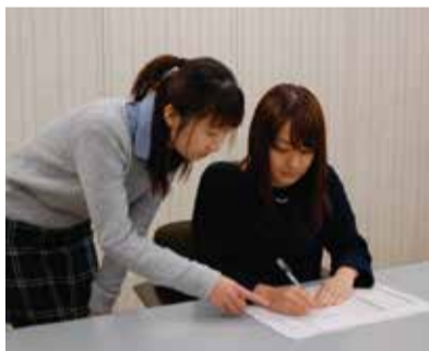
記入方法を丁寧に説明

問い合わせ 市民税課 ☎(82)5130 または 東京地方税理士会平塚支部 ☎(21)1055