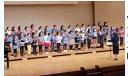
息を合わせて歌う

40回の節目を迎える今年は、市内12の音楽団体が、さまざまなジャンルの音楽を合唱・合奏します。 とき 1月26日(日) 午後1時～3時半 ところ 文化会館