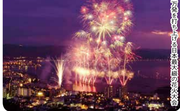
約四万発を打ち上げる日本最大級の花火大会