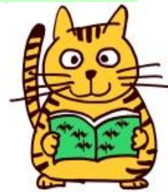
図書館のマスコット 〈よむよむ〉