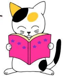
図書館のマスコット 〈みるみる〉