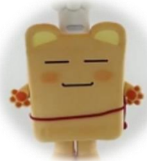
秦野市食育キャラクターポンチーヌ