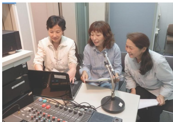
保健福祉センター3F 録音室での活動風景