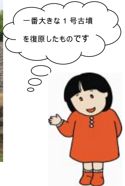
「広々として気持ちいい！子供も安心して遊べます！」 - 来館者の声 -