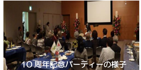
10周年記念パーティーの様子

秦野市と坡州市との国際交流は、1996(平成 8)年に神奈川県と韓国京畿道の仲介により、坡州市職員が友好都市候補として秦野市を訪問したことから始まりました。