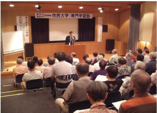
市民大学専門学習塾