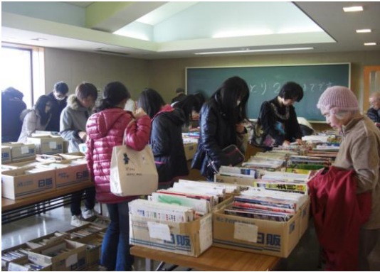
図書館リユース展

[視聴覚教材の活用] 視聴覚機材・教材の整備に努め、その活用を図ります。 ・ 映画会の開催 ・ 16ミリ映写機操作技術認定講習会の開催