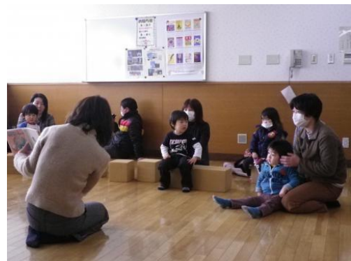
絵本とお友だち (家庭教育支援)