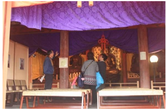
指定文化財特別公開