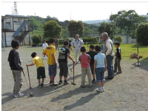
かみ放課後こども教室 (学校、家庭及び地域社会との連携)