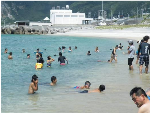
広域連携中学生洋上体験研修