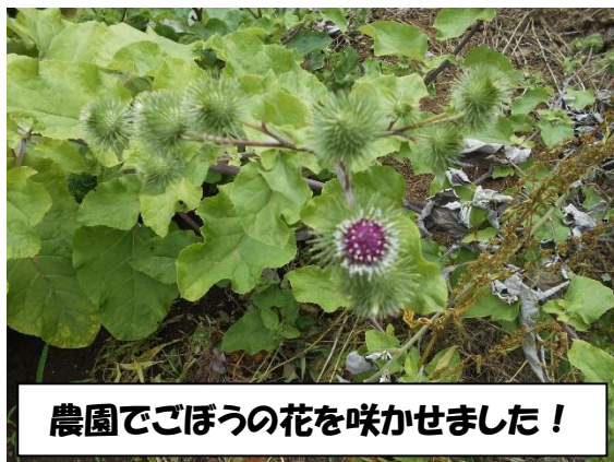
農園でごぼうの花を咲かせました！

今年の夏も「命にかかわる連日の猛暑」が、いつ訪れるのかと心配しています。今後35度以上になると発令される「高温注意情報」、炎天下での活動、海や川での事故にも注意ください。そして、2学期には、全員が元気な姿を見られたらと思っています。