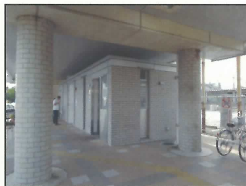
参考事例（茨城県下館駅）