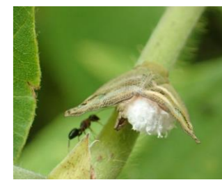
ベッコウハゴロモとハゴロモヤドリガ(白)

ベッコウハゴロモのお尻に、何やら白いもふもふが…ハゴロモヤドリガの幼虫が取りついていました。ハゴロモ類やウンカ類に寄生するガです。