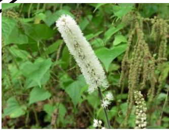
サラシナショウマ

10月の昆虫 チョウ・ガの仲間 モンキチョウ スジグロシロチョウの仲間 ナガサキアゲハ キタキチョウ アサギマダラ ヤマトシジミ サトキマダラヒカゲ ウラナシジミ クロヒカゲ ゴイシシジミ ツマグロヒョウモン ツバメシジミ ミドリヒョウモン ムシヤクロツバメシジミ アカタテハ イチモンジセセリ カタテハ チャバネセセリ クロノマチョウ キマダラセセリ ヒメジャノメ ホシホウジャク ヒメウラナミジャノメ シロモンノメイガ ヒカゲチョウ シャチホコガ(幼虫) コムシジ フタトガリコヤガ(幼虫) ハチ・アブ・ハエの仲間 オオスズメバチ キロスズメバチ コガタスズメバチ チャイロスズメバチ ハラナガツチバチの仲間 クロオオアリ クロヤマアリ アメリカミズアブ カメムシの仲間 クサギカメムシ キマダラカメムシ ホソヘリカメムシ アオバハゴロモ アミガサハゴロモ ツマグロオオヨコバイ バッタ・キリギリス・コオロギの仲間 ショウリョウバッタモドキ オンブバッタ コバネイナゴ ツチイナゴ セスジツユムシ サトクダマキモドキ ヒメクダマキモドキ その他の仲間 オオアオイトトンボ オオカマキリ(卵しょう) ムネアカハラビロカマキリ(卵しょう) トゲナナフシ チャタテムシの仲間