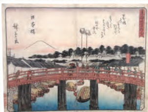
「東海道五十三次 日本橋」