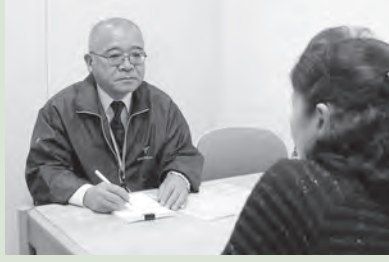
相談員が親身に対応

会場は、 市 =市役所 東 =東海大学前駅連絡所 保 =保健福祉センター 西 =西公民館 鶴 =鶴巻公民館 ほ =ほうらい会館 農 =秦野駅前農協ビル3階 ぱ =市地域生活支援センターぱれっと・はだの(本町2-7-25)。各相談とも、祝・休日はお休みします。