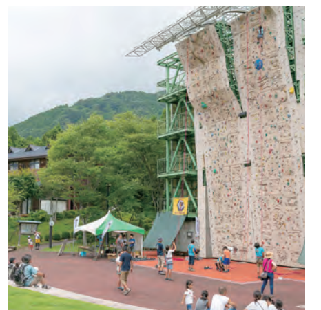
山岳スポーツの聖地を目指す(写真は県立山岳スポーツセンター内)

機能障害者向けにスマートフォンなどを活用した「Net119緊急通報システム」を導入します。