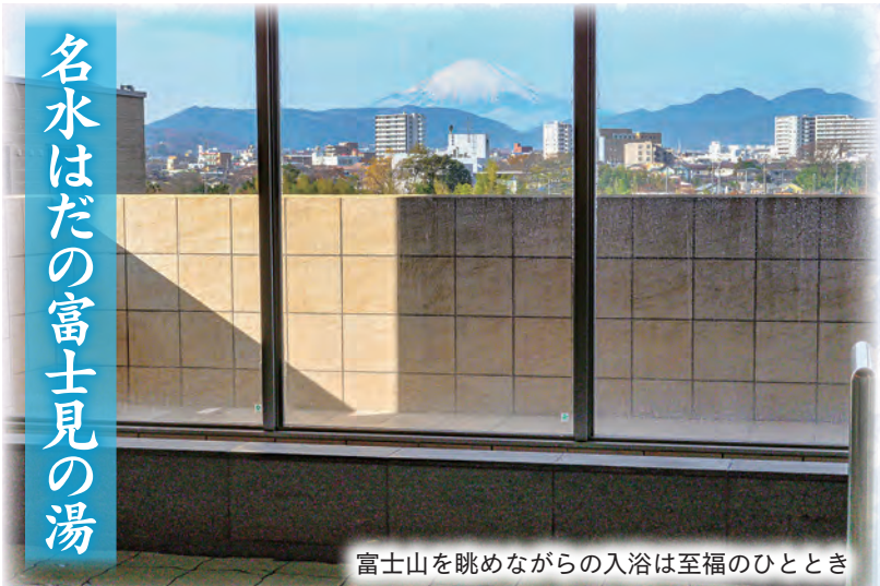
富士山を眺めながらの入浴は至福のひとつ