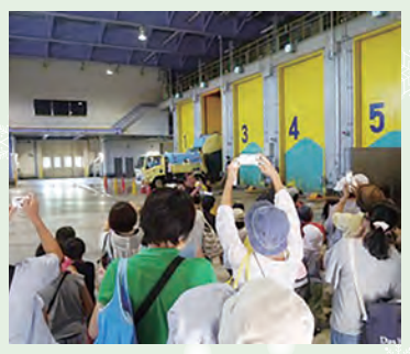
普段見られない場所の見学も

とき 1月26日(日) 午前10時～午後2時 ところ はだのクリーンセンター、名水はだの富士見の湯 内容 宝探しスタンプラリー、クリーンセンタークルーズ、探検ガイドツアー(予約優先)、抽選会 ※探検ガイドツアーは、午前10時半から1時間間隔で実施