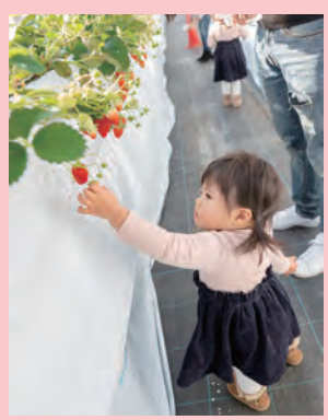
採れたてのイチゴは格別

とき 1月上旬～5月下旬 申し込み ◇ファームスクエア丹沢の森(堀西1328) ☎080(2098)4452 ◇かたのいちご園(戸川1063) ☎090(8114)2082 ◇石田ファーム工房(横野582-1、戸川639-1) ☎090(1463)1583 ◇村上いちご園(戸川1235) ☎080(8181)9919 費用 700～1950円(子供は500～1450円)