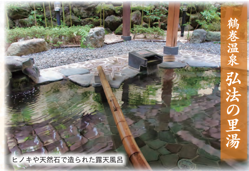
ヒノキや天然石で造られた露天風呂