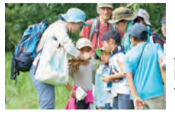
ガイドの説明付き