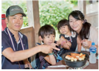
薫製の香りが広がる

薫製料理など、アウトドアをもっと楽しくする料理の体験講座と、登山中の行動食などの試食ができます。