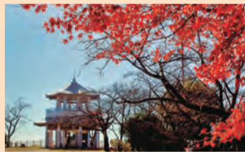
秋色に染まる弘法山公園

とき・ところ 午前9時鶴巻温泉駅北口集合～弘法山～名水はだの富士見の湯(入浴)～午後3時秦野駅 ※名水はだの富士見の湯で解散可 内容 野鳥や植物の観察 定員 30人(申し込み先着順) 費用 50円