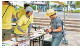
受付で限定ピンズをGET

アプリ「ヤマスタ」でデジタルスタンプを集め、達成トロフィーを提示すると、限定ピンズをプレゼント。当日飛び入り参加できる、平和橋～会場まで歩くコースもあります。