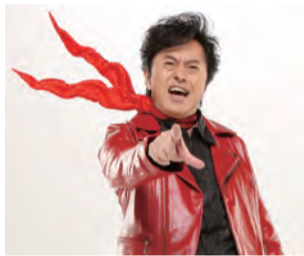
「ゼーット」の掛け声が聞けるかも

登山・アウトドア業界の著名人による、登山や自然にまつわるトークイベントを開催。イベント終了後にはサイン会も。アニメソング界のカリスマ・水木一郎さんも出演します。