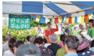
より楽しく安全に