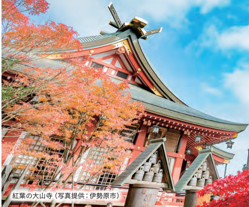
紅葉の大山寺