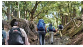
安全な登山を学ぼう

GPSを活用した地図読み講座など、山を安全に楽しむための知識を登山しながら学びます。