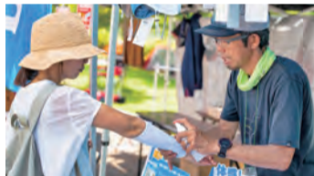
掘り出されるかも

テーピング体験、登山靴のフィッティング、ビーコン宝探しなど、体験しながら登山を学べます。