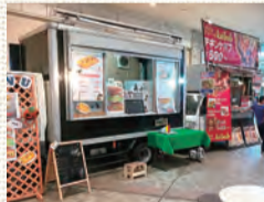
出店するキッチンカー

とき 10月12日(土)～14日(月) 午前10時～午後3時 ※雨天中止 販売品目 ハンバーガー、ケバブ、ソフトクリームなど