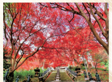
紅葉が美しい大山寺

とき・ところ・内容 午前8時50分伊勢原駅北口改札前集合～大山ケーブル駅～女坂～大山寺～下社～蓑毛越え～蓑毛～午後3時秦野駅(健脚向け) 定員 50人(申し込み先着順) 費用 500円 ※バス代は実費