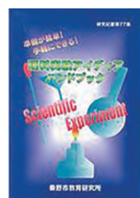
夏休みの自由研究にもぴったり

内容 ペットボトルやごみ袋など、身近な材料を使った実験を紹介 販売場所 市役所教育庁舎2階教育研究所、ファミリーマート秦野市役所前店 価格 1800円