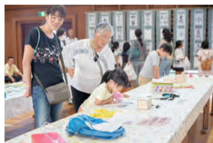
アイデア作品を応募しよう