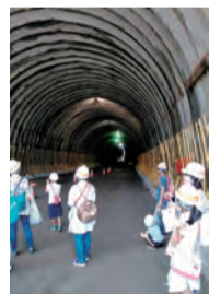
実際に見る現場は驚きの迫力

とき 8月22日(木) 午前9時15分渋沢駅北口上地区乗合自動車停留所前集合~午後0時15分 対象 市内在住の小学生以上の親子10組20人(申し込み先着順) 申し込み 7月16日(火)~電話のみ受け付け