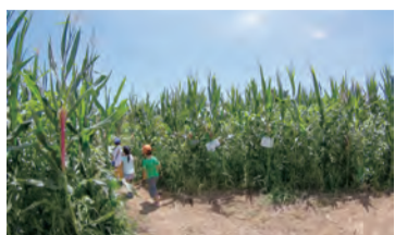
迷路から脱出しよう