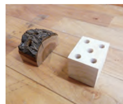
使用するのは秦野産のスギの木