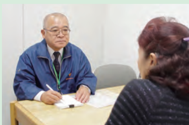
相談員が親身に対応

会場は、 市 =市役所 東 =東海大学前駅連絡所 保 =保健福祉センター 西 =西公民館 鶴 =鶴巻公民館 ほ =ほらい会館 農 =秦野駅前農協ビル3階 ぱ =市地域生活支援センターぱれっと・はだの(本町2-7-25)。各相談とも、祝・休日は休み。