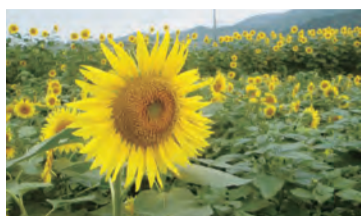
約1万本のひまわり畑

高さ1.5mのデントコーン(飼料用のトウモロコシ)で作った迷路。隣にはひまわり畑の絶景が広がります。