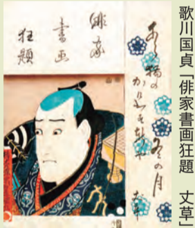
歌川国貞「俳家書画狂題」文章