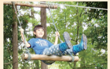
自然の中でこぐブランコは爽快

ところ 上小学校など 内容 ドラム缶風呂や里山散策、地元の食材を使った昼食交流会など 定員 100人(申し込み先着順。小学生以下は保護者同伴) 費用 1000円(2歳以下は無料。3歳～小学生は500円) 申し込み 住所、氏名、電話番号、参加人数、会場までの交通手段を書いてメール(k-kyousei@city.hadano.kanagawa.jp)。電話も可