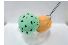
かわいいアイスを2種類制作できる

とき 8月12日(月) 午後1時半~3時半 ところ 宮永岳彦記念美術館 対象 市内在住の小・中学生20人(申し込み先着順) 費用 300円 申し込み 7月16日(火)~